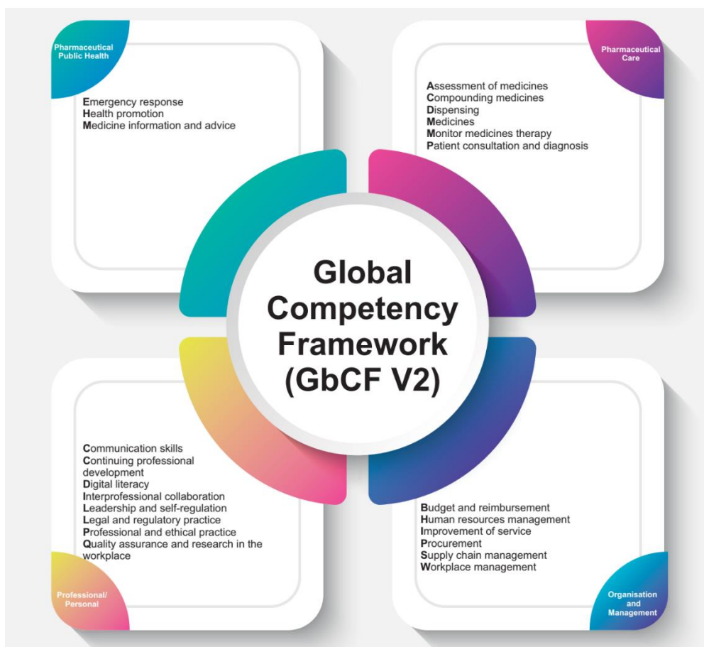
Slika 2. GbCF verzija 2